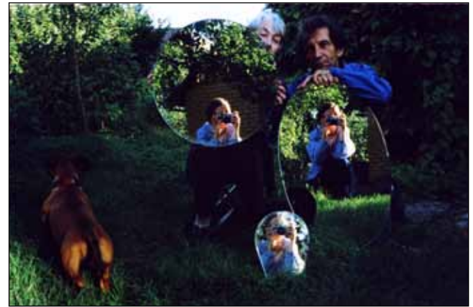
Ksenia Galiaeva, Untitled , 2011, analoge kleuren- foto

Th – Ik heb nog nooit aan die vergelijking gedacht bij mijn tafels. De vrouw die op de tafel zit zou je een figuur in amazonezit kunnen noemen. Wanneer je paardenbuiken met de onderkanten van tafels vergelijkt zijn beide niet bijzonder interessant, toch?