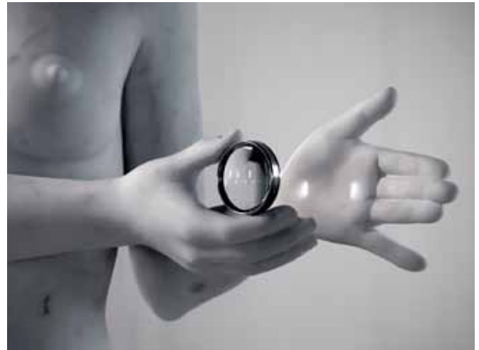
Thom Puckey, Treachery , 2013 Statuario marmer, lens 122,5 x 64 x 165 cm