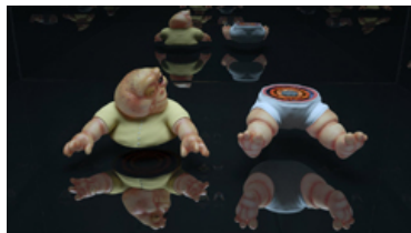
Andrew Norman Wilson, 'Baby Sinclair (The Unthinkable Bygone)', video still, 2015

hoofdlocatie: Stroom Den Haag, Hogewal 1-9, Den Haag