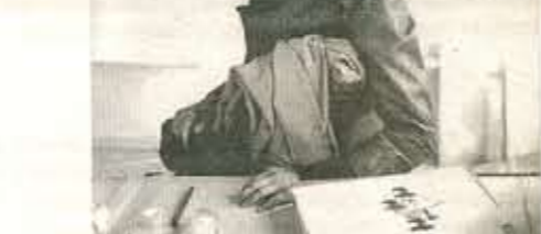
Jill Magid foto Jill Magid

„Mijn opdracht was de organisatie een gezicht te geven. Maar zelf was ik vooral geïnteresseerd in een existentiële vraag, namelijk: wat is het gezicht van de macht? Wie zit er in het