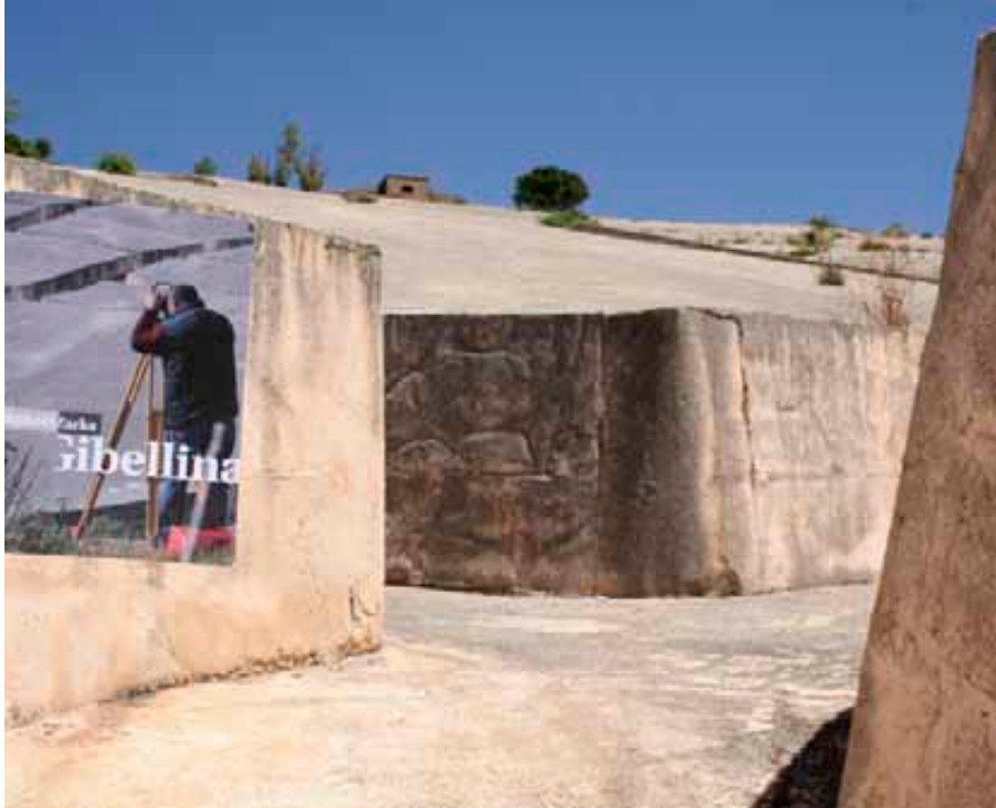
Il Grande Cretto Alberto Burri

collegiale verbintenis - ontstaan sinds de presentatie van 'Modern@ité' bij Stroom in 2006 - extra onderstreept.