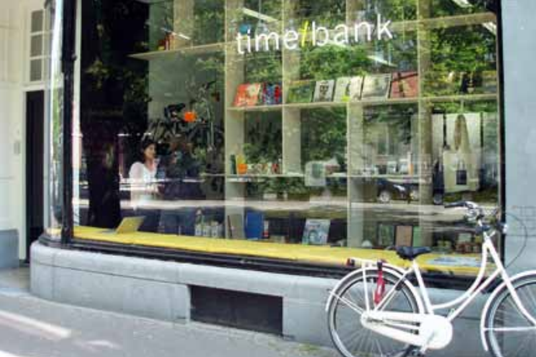
Time/Store Den Haag