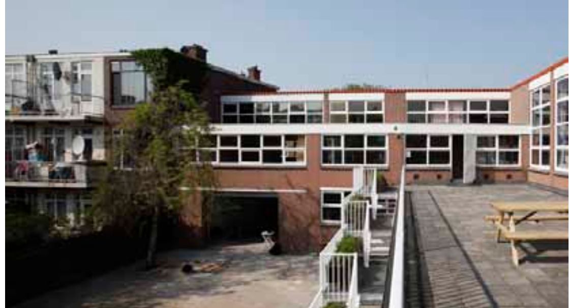
Atelierpand Abraham van Beijerenstraat 4

Met behulp van een OBJECT subsidie van Stroom is een bijdrage geleverd aan de verbouwing van het pand ten behoeve van elf ateliers. Billytown heeft als pand een semi-permanente status; en is zeker beschikbaar voor de komende drie jaar.