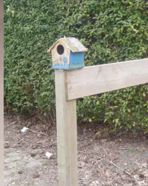
Making Do in Den Haag

In 2011 werd het meerjarenprogramma 'Upcycling' voortgezet. Hierin beschouwt Stroom Den Haag waardecreatie vanuit een artistiek, maatschappelijk en filosofisch oogpunt. Dit kwam onder andere tot uitdrukking in de tentoonstelling 'There, I Fixed It' en de opening van de Nederlandse vestiging van de e-flux Time/Bank waarbij niet geld, maar tijd als betaalmiddel wordt gehanteerd.