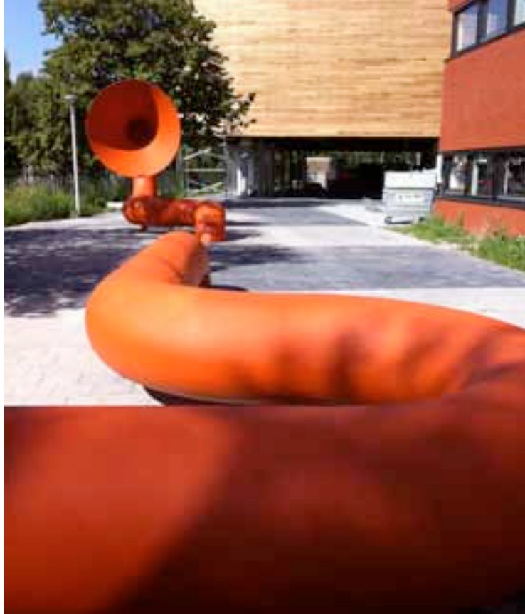
Maris College Bisscheroux & Voet

Het kunstwerk dat het duo Bisscheroux & Voet voor het Maris College maakte, heeft alle snelheidrecords gebroken. Binnen een jaar kwamen zij van de eerste gesprekken tot de oplevering van het beeld. Ze ontwierpen de 'Woofah', een 80 meter lange oranje buis die over het schoolplein kronkelt en uitmondt in een gigantische toeter. Als de bel gaat klinkt er iedere week een ander geluid waarmee de leerlingen naar binnen worden geroepen. De school geeft in haar lesprogramma uitleg bij de geluiden en de leerlingen zijn vrij om er zelf nieuwe geluiden aan toe te voegen. Het Maris College heeft zich aangemeld bij het 'Guinness Book of World Records' voor de grootste schoolbel ter wereld.