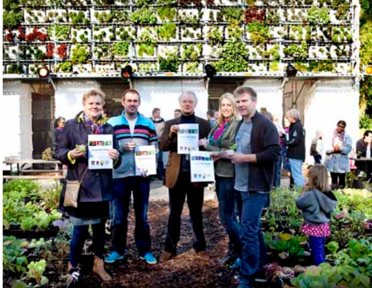
Presentatie initiatiefnota '(H)eerlijk Haags'

4 oktober werd een workshop gehouden om de kansen te verkennen van de bijzondere nutsverenigingen, naar het concept van Studio Makkink & Bey. Vijftien vertegenwoordigers van lokale partijen zoals de volkstuinvereniging Nooitgedacht, de Haagse Bond van