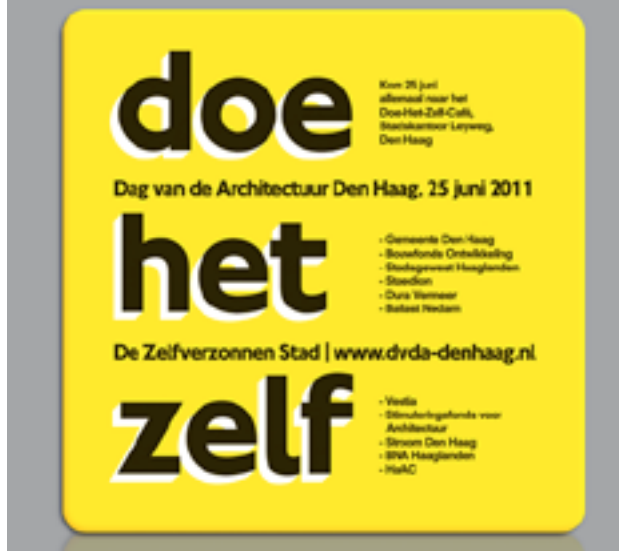
Dag van de Architectuur bierviltje

Het thema en de keuze om de dag op Den Haag Zuidwest te concentreren betekende dat er een heel ander soort gebouwen dan gebruikelijk opengesteld waren: weinig nieuwbouw en minder spectaculair. Dat was wellicht ook de reden dat er minder bezoekers dan gebruikelijk waren. De rondleidingen door het stadskantoor waren echter allemaal volgeboekt. En ook het slotevenement met de film, een modeshow door bewoners van de wijk en het debat waren goed bezocht.