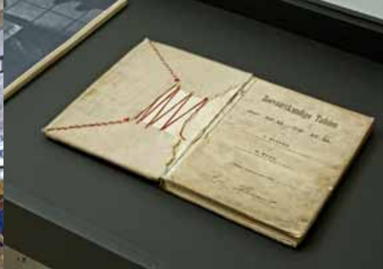
Indian Cress Krijn Giezen

'There, I Fixed It' staat voor een mentaliteit en een manier van kijken naar materialen en problemen die brutaal en onverwacht zijn – tegendraadse oplossingen voor urgente problemen. Die problemen kunnen klein en alledaags zijn, maar ook groot en wereldomvattend. De tentoonstelling presenteerde werk dat wordt gekenmerkt door het vermogen van het 'gewone' iets buitengewoons te maken. Dit deden de kunstenaars door uniek materiaalgebruik, een andere kijk op wat bruikbaar is en een groot gevoel voor improvisatie, zelfwerkzaamheid en tijdelijkheid. Was 'Up to You' in 2010 een uitnodiging om vanuit de open vorm van het getoonde werk anders naar de directe omgeving te kijken, dan presenteerde 'There, I Fixed It' creatieve antwoorden om de werkelijkheid naar eigen hand te zetten. Het werk van de in januari 2011 overleden Krijn Giezen vormde een belangrijke referentie voor deze manier van werken. De voorbereiding en lancering van de Nederlandse branche van de e-flux Time/Bank vormde een duurzaam onderdeel van 'There, I Fixed It'.