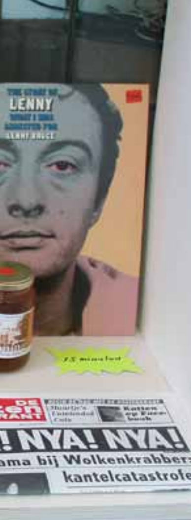
Time/Store Den Haag