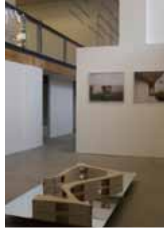
Trial House Anne Holtrop

In het volgende overzicht zijn tentoonstellingen, presentaties, lezingen en debatten, overige activiteiten en educatieve projecten in chronologische volgorde opgenomen. Om de samenhang tussen verschillende elementen uit ons programma aan te geven zijn deze, waar dit van toepassing is, in onderling verband en met de eventuele doorwerking ( spin-off ) beschreven.