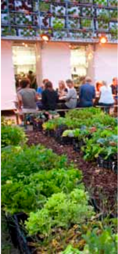
EETFABRIEK Atelier GRAS!