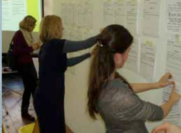
Time/Bank Live Session

Na de beoogde proefperiode van een jaar zal Stroom in 2012 zowel intern als met de consultants Time/Bank Den Haag evalueren. Daarbij zal zeker aan de orde komen in