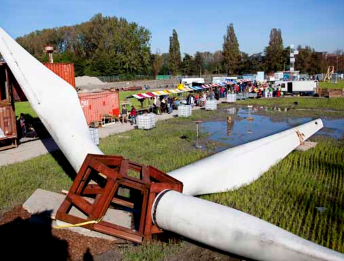
DAG HAP terrein Refunc