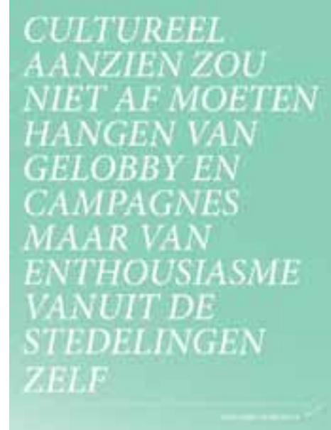
Flyer Jegens & Tevens

De Architectuuragenda Den Haag is een maandelijkse digitale agenda waarin alle architectuurgerelateerde activiteiten in Den Haag en omgeving worden vermeld. In 2011 verscheen de zevende jaargang. De agenda werd naar een relatiebestand verstuurd van meer dan 1350 betrokkenen. De redactie van de agenda ligt in handen van Stroom Den Haag, maar ze betreft veel van haar kopij van partners als BNA Kring Haaglanden, Haags Architectuur Café (HaAC), Het Nutshuis en de Satellietgroep. De agenda biedt ook een aantrekkelijk communicatieplatform voor de activiteiten van de Gemeente Den Haag en Haagse kunstenaarsinitiatieven. De agenda kwam in 2011 acht keer uit. In de maanden januari, juli/augustus verscheen geen uitgave. De Architectuuragenda is ook op internet te raadplegen via de website van Stroom en ArchiNed.