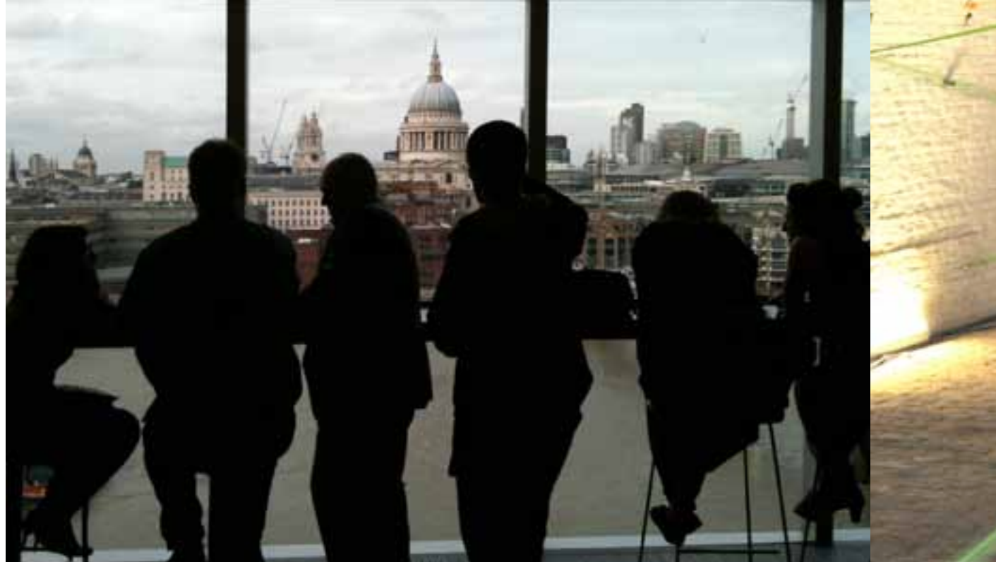
Studiereis naar Londen