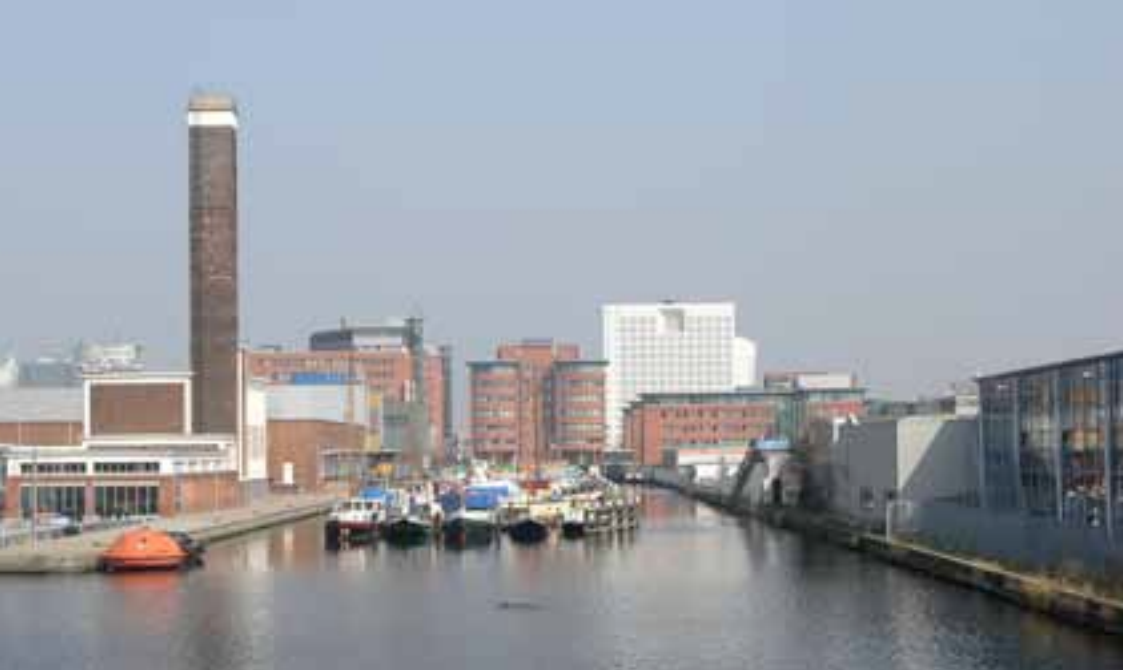
Binnenhaven in de Binckhorst