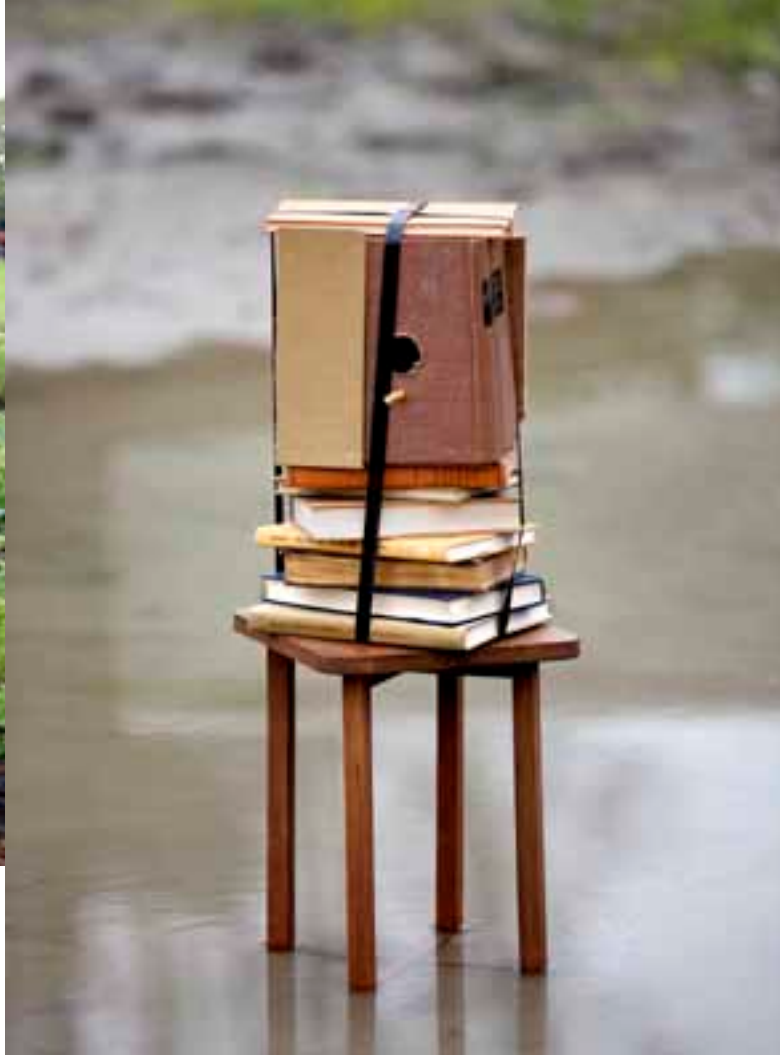
Composted Constructions Fritz Haag

Stroom is ervan overtuigd dat kunst een positieve bijdrage kan leveren aan dit thema. Niet alleen door het signaleren en bewust maken van de maatschappelijke problemen, maar ook door op een creatieve en visionaire wijze oplossingen aan te dragen voor dit vraagstuk. Via lezingen, workshops, tentoonstellingen en kunstprojecten tonen kunstenaars, architecten, ontwerpers, wetenschappers, voedselexperts en burgers wat voedsel