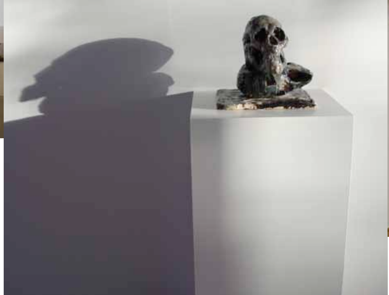
Two modeled skulls and base, The Bowery, August 2007, 7pm Andrew Lord

'Speak, Memory' was een internationale groepstentoonstelling waarin herinneringen, het geheugen en het verstrijken van de tijd centraal stonden. Persoonlijke verhalen, vervormde herinneringen, verloren momenten en sporen van gebouwen waren verbindende elementen tussen de werken in deze tentoonstelling. Net als 'One on One' in Brno