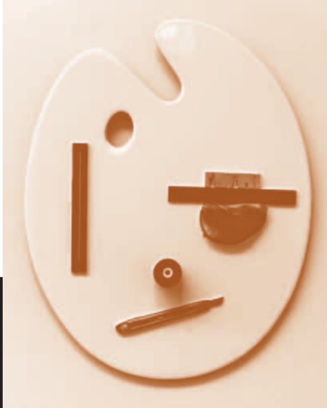
The Artist Vittorio Roerade