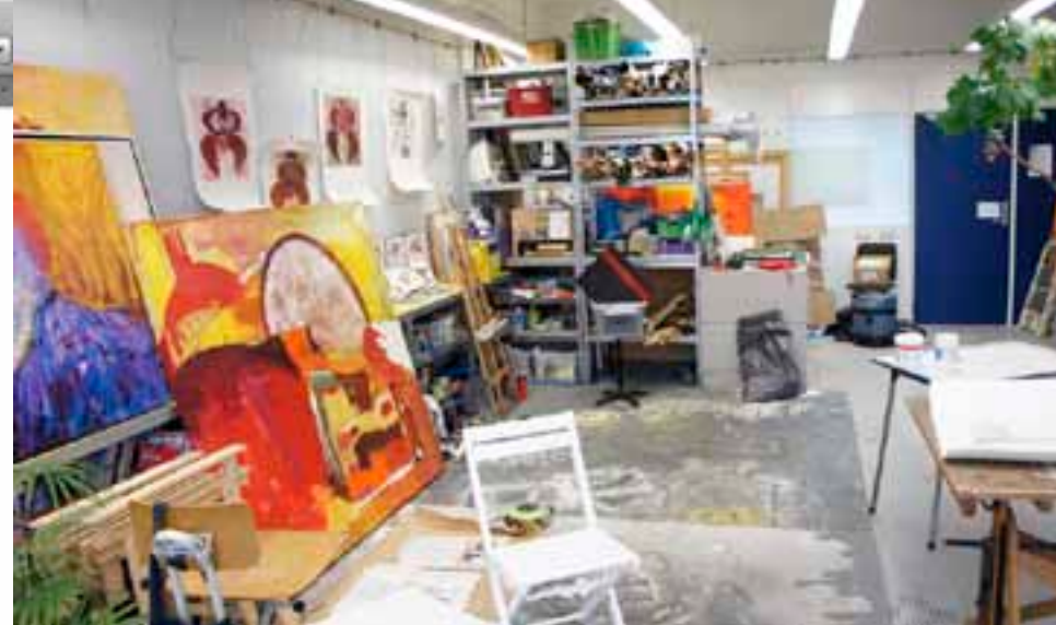
Atelierruimte in Binck 36

Naast permanente ateliers blijft de behoefte aan tijdelijke ateliers onder kunstenaars groot, zowel bij starters als kunstenaars die al langer hun beroep uitoefenen. Een groot deel van de kunstenaars in Den Haag wil graag van deze tijdelijke en dus goedkope 'om niet' atelierruimten gebruik maken vanwege hun inkomenspositie. Zo heeft Stroom