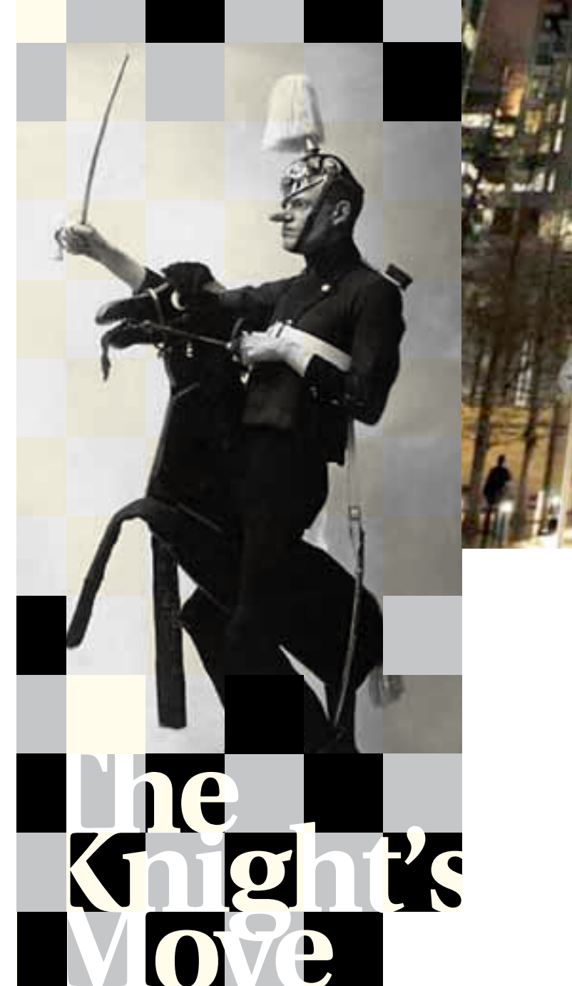
The Knight's Move Flyer

De gemeente wil met de uitgangspunten voor de nieuwbouw voor de Hoge Raad en Eurojust de identiteit van Den Haag als Internationale Stad van Recht en Vrede