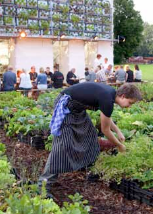
EETFABRIEK Atelier Gras!

'Foodprint. Voedsel voor de stad' is een meerjarenprogramma over de invloed van voedsel op de cultuur, inrichting en het functioneren van steden en van Den Haag in het bijzonder. Het programma richt zich niet alleen op artistieke uitgangspunten, maar omvat ook thema's als duurzaamheid en milieu. Hiermee dient het interdisciplinaire programma van 'Foodprint' een breed maatschappelijk belang.