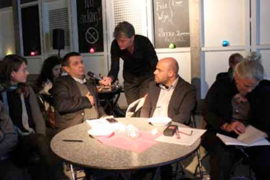
Binckcafé 5: Balkan in de polder?

impulsen en verrassende inzichten geven. Dwars door alle disciplines heen. De knight reflecteert daarbij eveneens aan de status van degenen die we uitnodigen. Inhoud van de lezingen en status van de sprekers waren voor De Groene Amsterdammer ook reden om de lezingenserie in 2011 als mediapartner te ondersteunen. Voor het eerst vroeg Stroom entreegeld voor de lezingen van 'The Knight's Move'. We deden dit niet alleen om inkomsten te genereren, maar ook om de discrepantie tussen het aantal reserveringen en het aantal bezoekers te ondervangen en daarmee de organisatie efficiënter te laten verlopen. Een significante verlaging van het aantal bezoekers in 2011 toonde aan dat de prijselasticiteit bij het potentiële publiek beperkt is. Een deel van het publiek is nadrukkelijk wel bereid een financiële bijdrage te leveren voor het bijwonen van deze bijzondere lezingenserie. Deze ervaring stimuleert Stroom in het ontwikkelen van creatieve en flexibele instrumenten die inkomstenvormend zijn, maar ook de diversiteit van het publiek waarborgen.