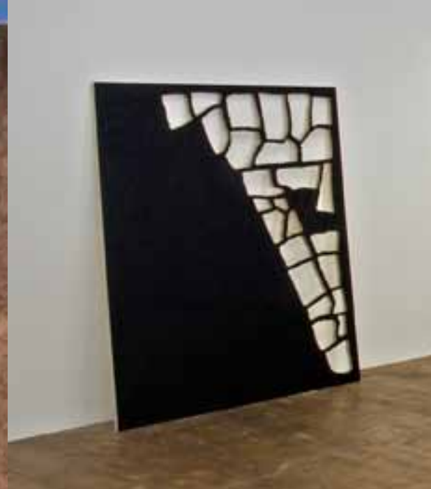
La Déduction de Burri Raphaël Zarka

Samenwerking van Stroom met Netwerk leidt in 2011 tot bezoek van Franse en Britse professionals aan Nederland met veel tijd en aandacht voor Haagse kunst en kunstenaars.