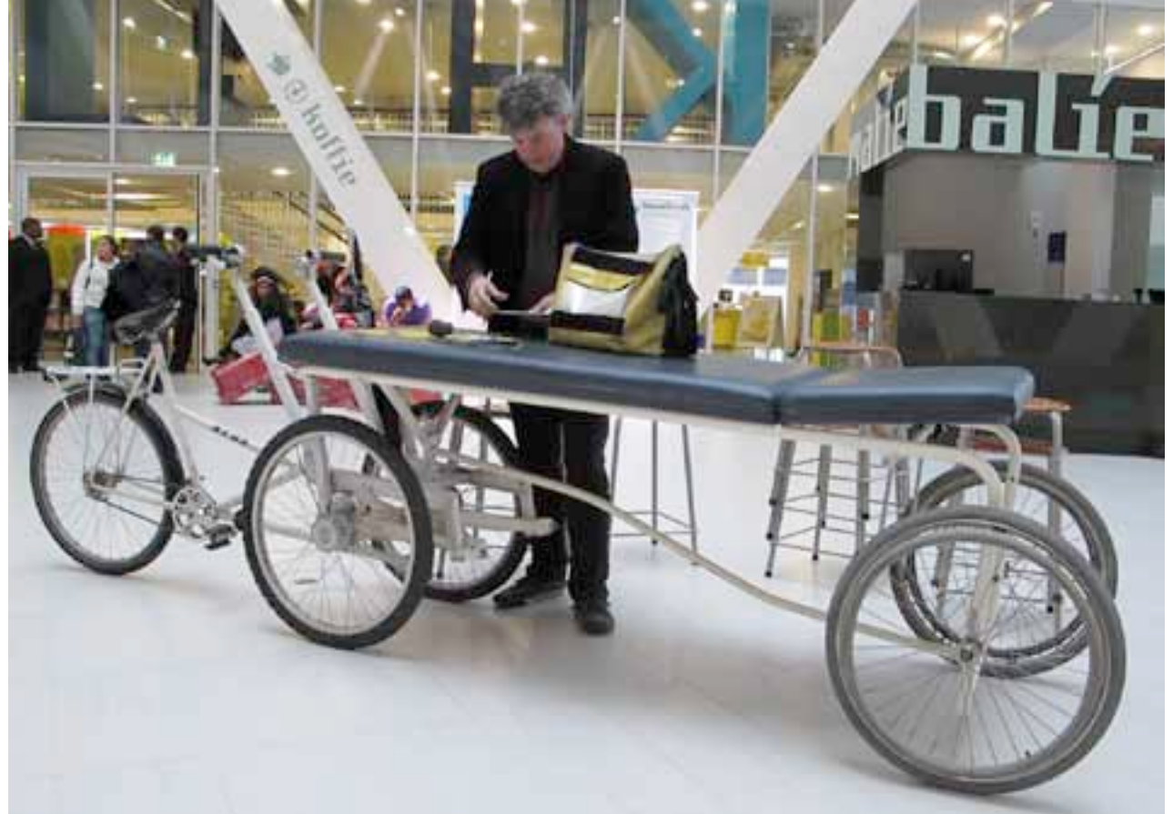
Doe-Het-Zelf Café Refunc

In aansluiting bij de thematiek van de Dag van de Architectuur en onze tentoonstelling 'There, I Fixed It' nodigde Stroom het publiek uit digitaal foto's in te zenden van