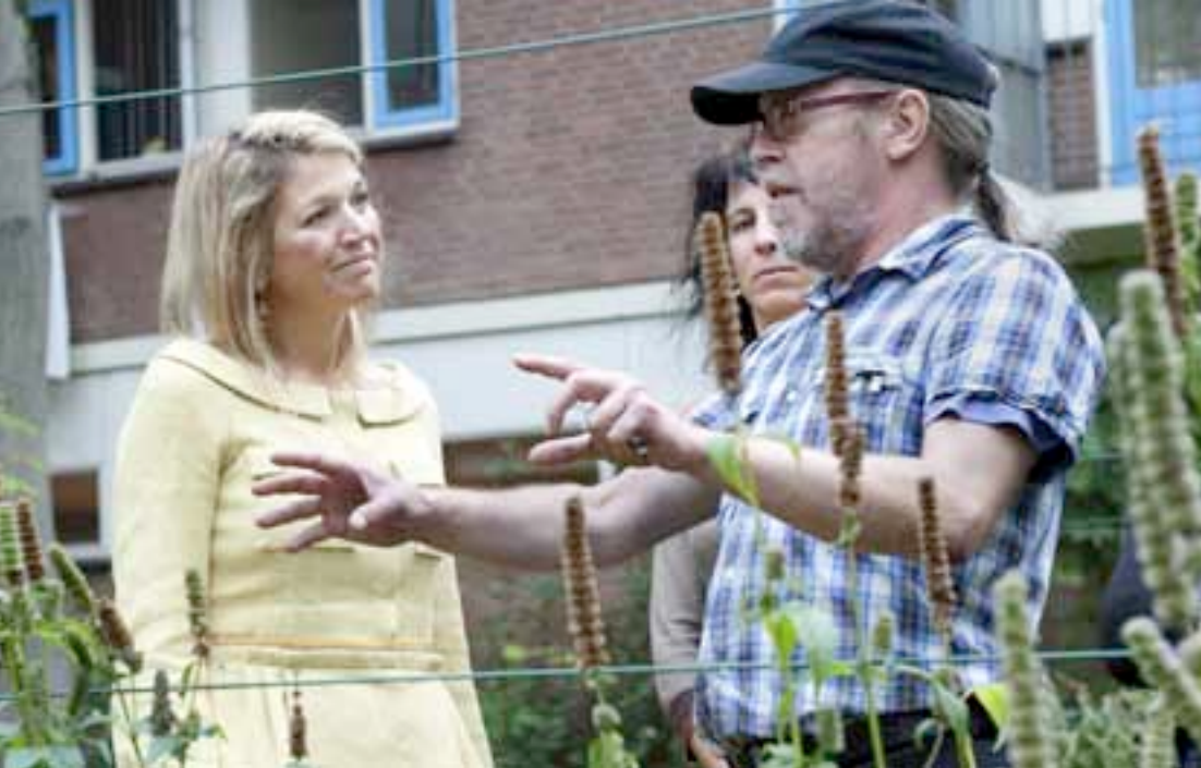
Prinses Máxima bezoekt Foodscape Schilderswijk

is om onder te opereren? Heeft Stroom Den Haag als representant van de culturele peiler onder het Foodprintprogramma een rol in dit vervolg?