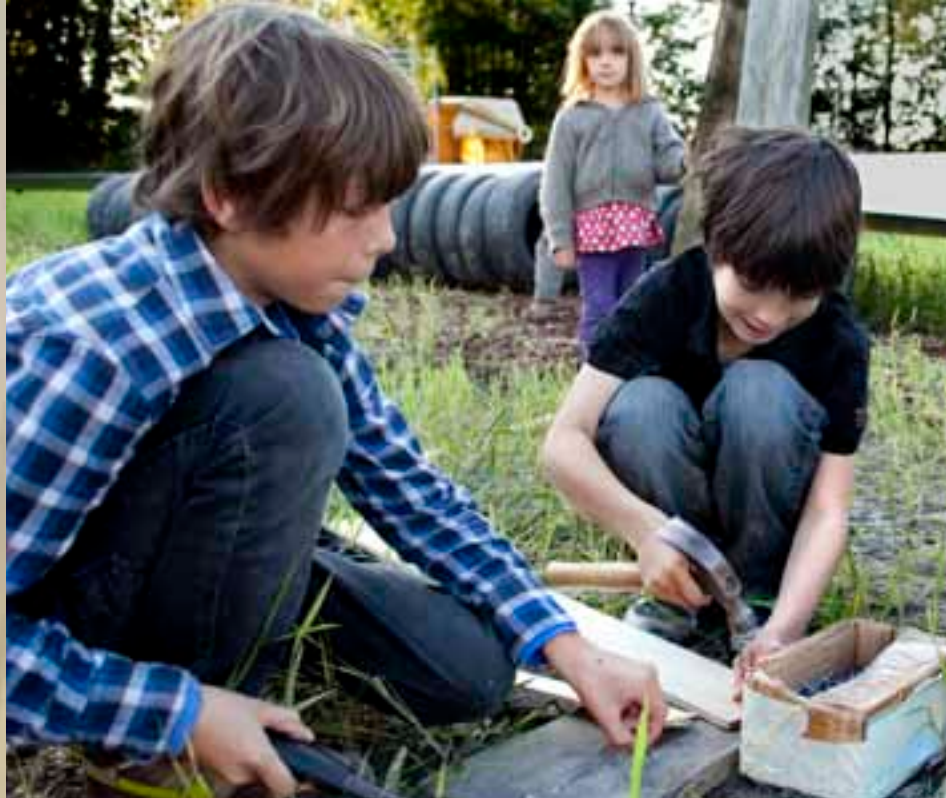
DAG HAP workshops Refunc