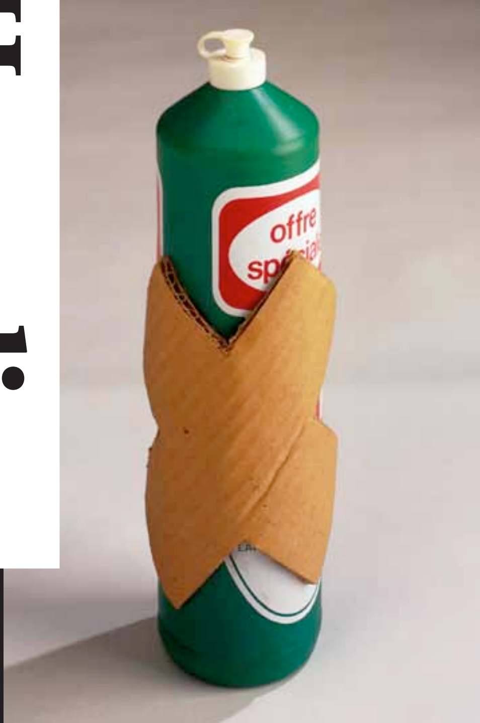
Zonder titel René Heyvaert