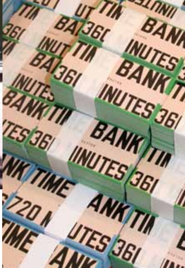
Time/Bank Hour Notes