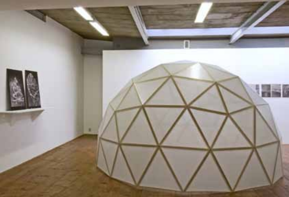
Geodetische koepel naar R. Buckminster Fuller Walter de Ley

We hebben gemerkt dat generieke ondersteunende middelen als een internationale groepstentoonstelling en publicaties volgens een vast format niet de optimale middelen zijn om Haagse kunstenaars in de versnelde ontwikkeling en verdieping van hun praktijk te ondersteunen. In de loop van 2011 (en ten behoeve van de kunstenaars die in 2010 een Premium subsidie ontvingen) zijn we daarom overgegaan op stimulerende activiteiten die op maat zijn gesneden van de behoefte van de betreffende kunstenaars (zie p. 63).