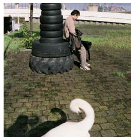
ZIE OOK PAGINA 14 EV

De Binckhorst ondergaat de komende jaren een herontwikkeling. Uiteindelijk moet het binnenstedelijke bedrijfsterrain de creatieve voorhoede van de stad worden. Volgens Stroom is het daarom het moment om de Binckhorst in beeld te brengen. [AD/HC, 19 SEPTEMBER 2005]