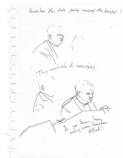
ZIE OOK PAGINA 11

Daarnaast vormde de tentoonstelling de achtergrond voor een discussieavond over 'The Hague World Forum', de nieuwe naam van het terrein waarop niet alleen het Joegoslavië Tribunaal zich bevindt, maar waar ook Europol zich binnenkort vestigt. Het werk van Grubanov hebben wij opgevat als kader om over enkele actuele aspecten van Den Haag te denken, zoals de status van internationale instellingen, het adagium 'stad van recht en vrede' en de relatie tussen veiligheid en openbaarheid.