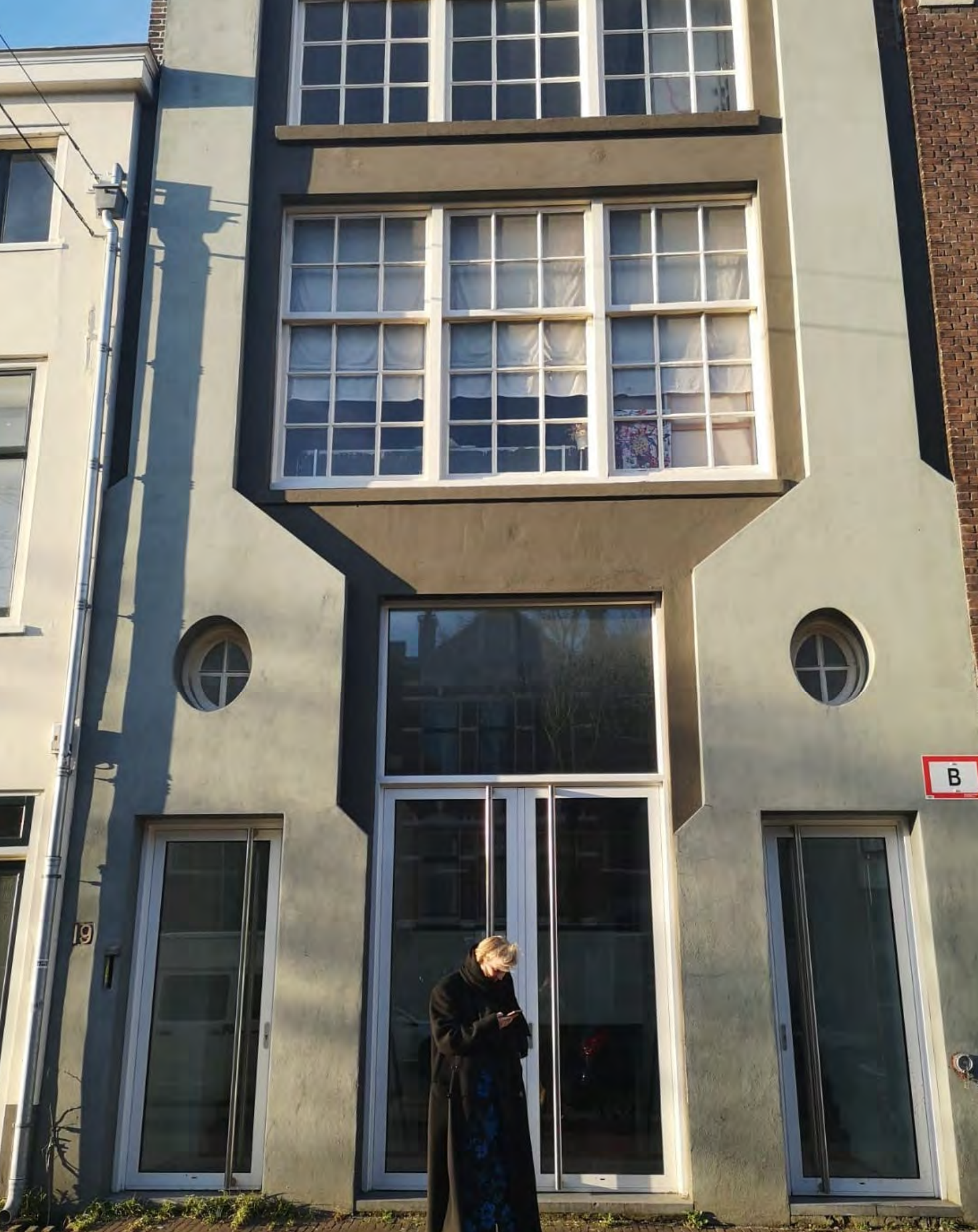
Atelierbeleid: nieuw pand voor ontwerperscollectief Das Leben am Haverkamp