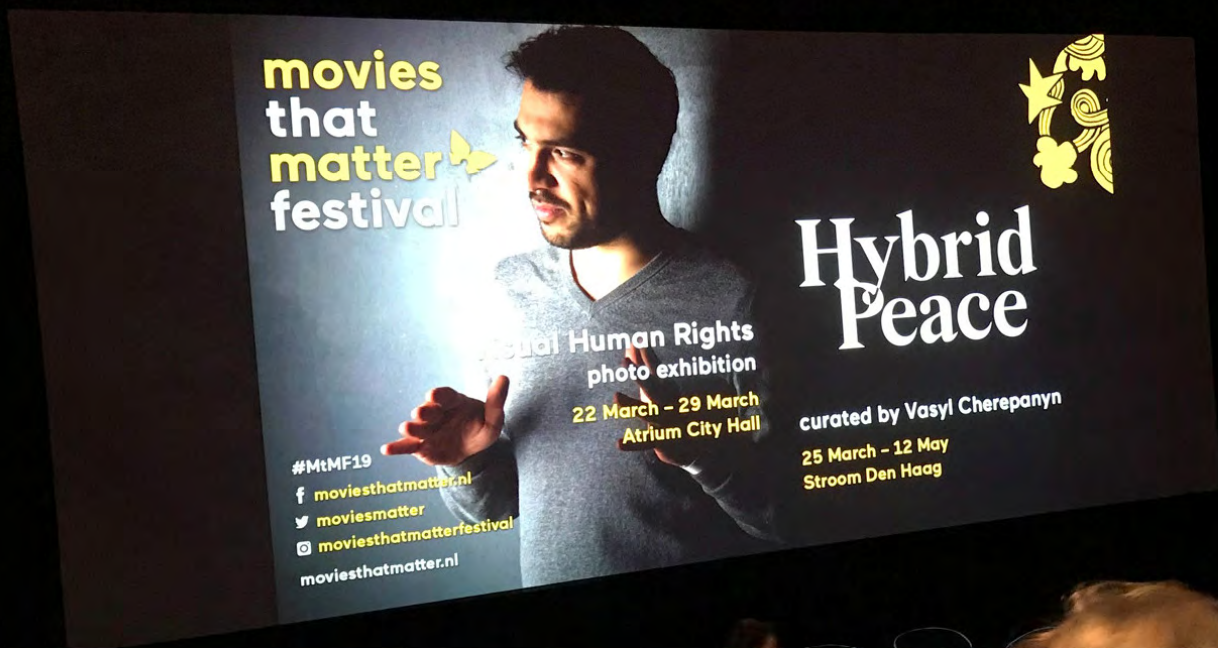
Our House, your Home: Hybrid Peace door VCRC, Kiev: screening tijdens Movies that Matter Festival