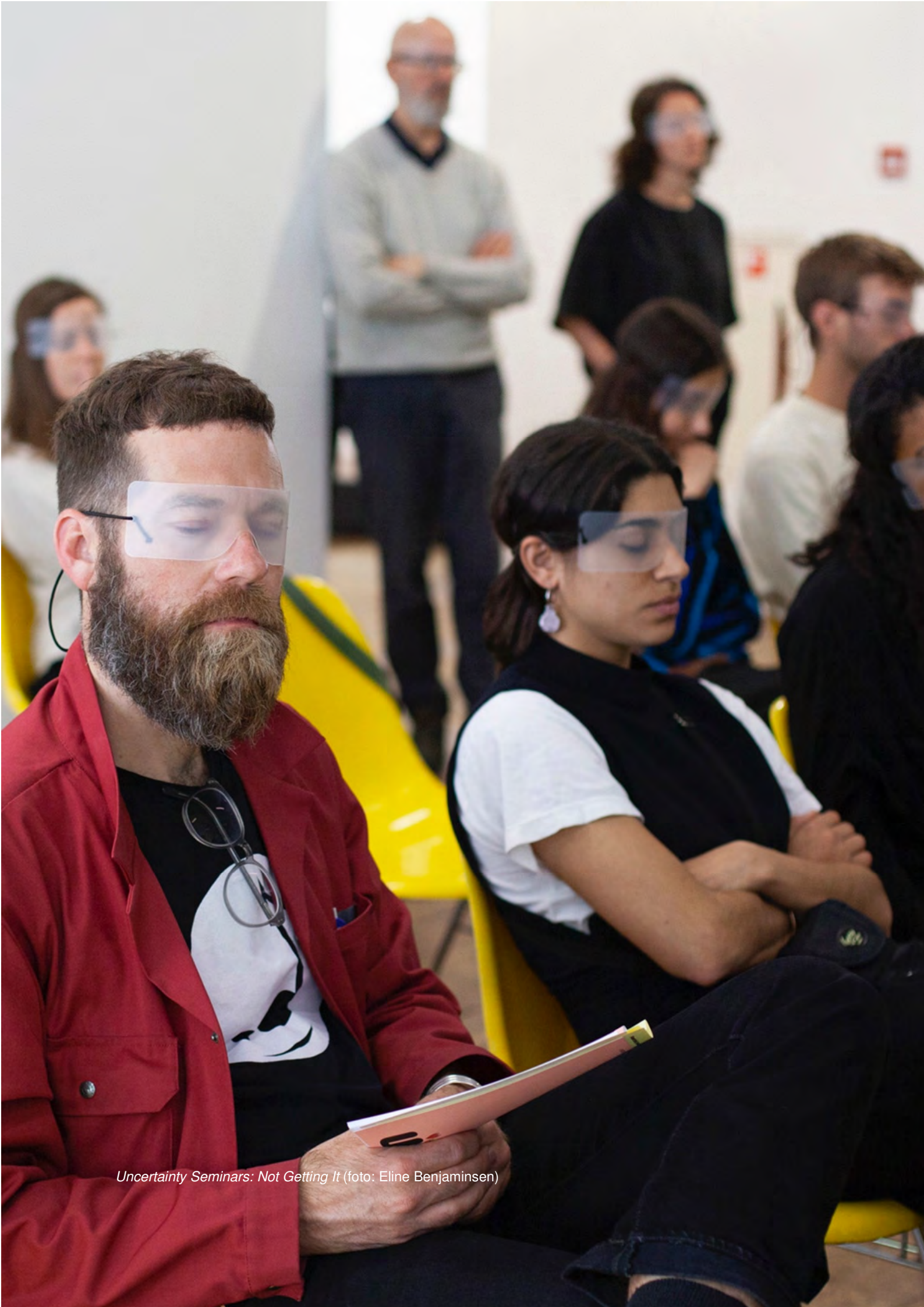
Uncertainty Seminars: Not Getting It