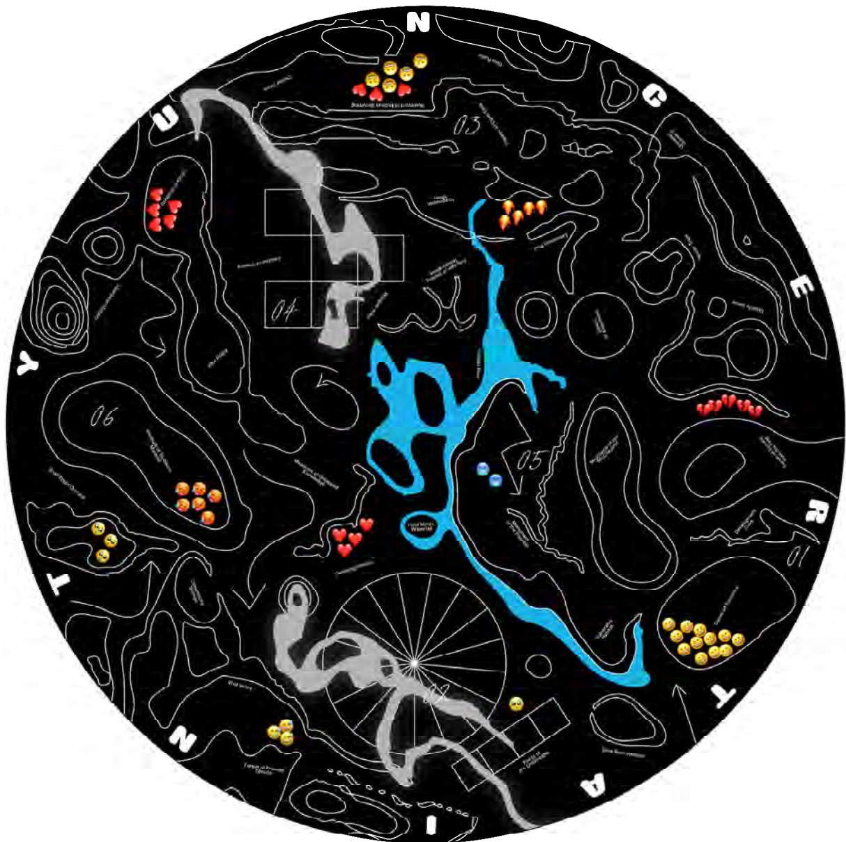
Uncertainty Seminars: The Map of Scattered Society (ontwerp: Studio The Rodina)