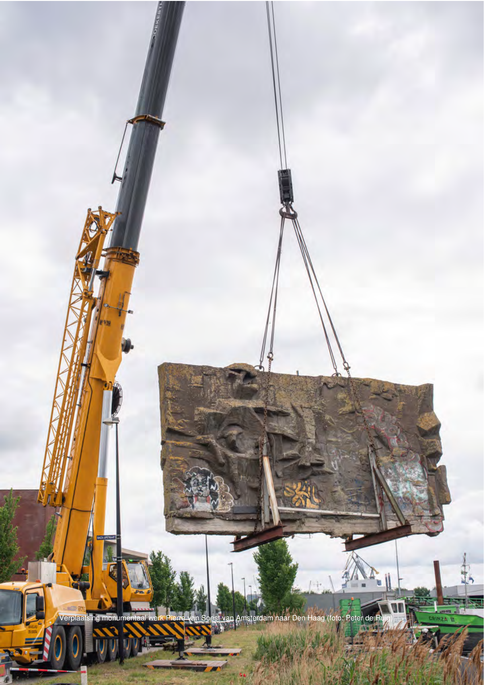
Verplaatsing monumentaal werk Pierre van Soest van Amsterdam naar Den Haag