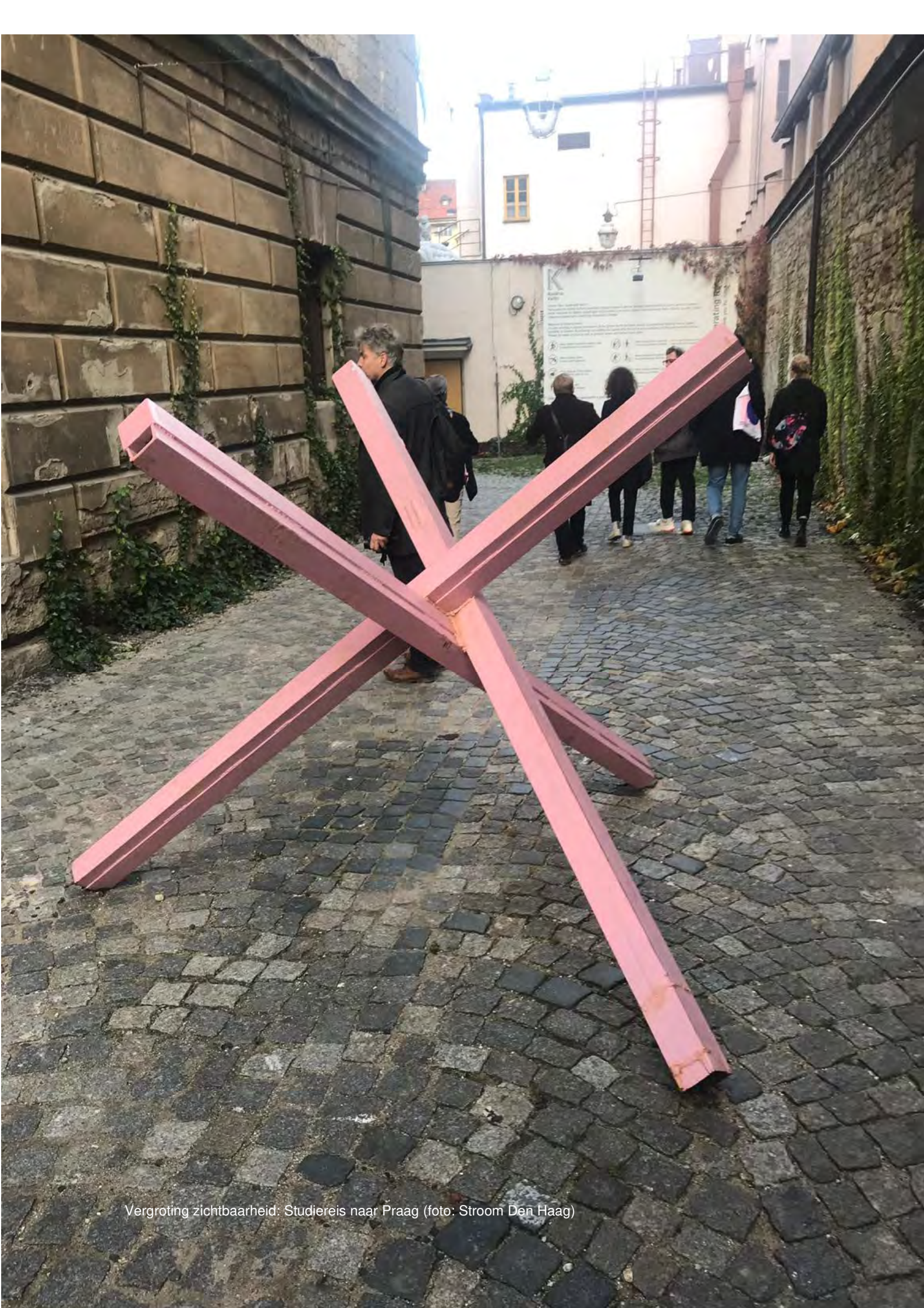
Vergroting zichtbaarheid: Studiereis naar Praag