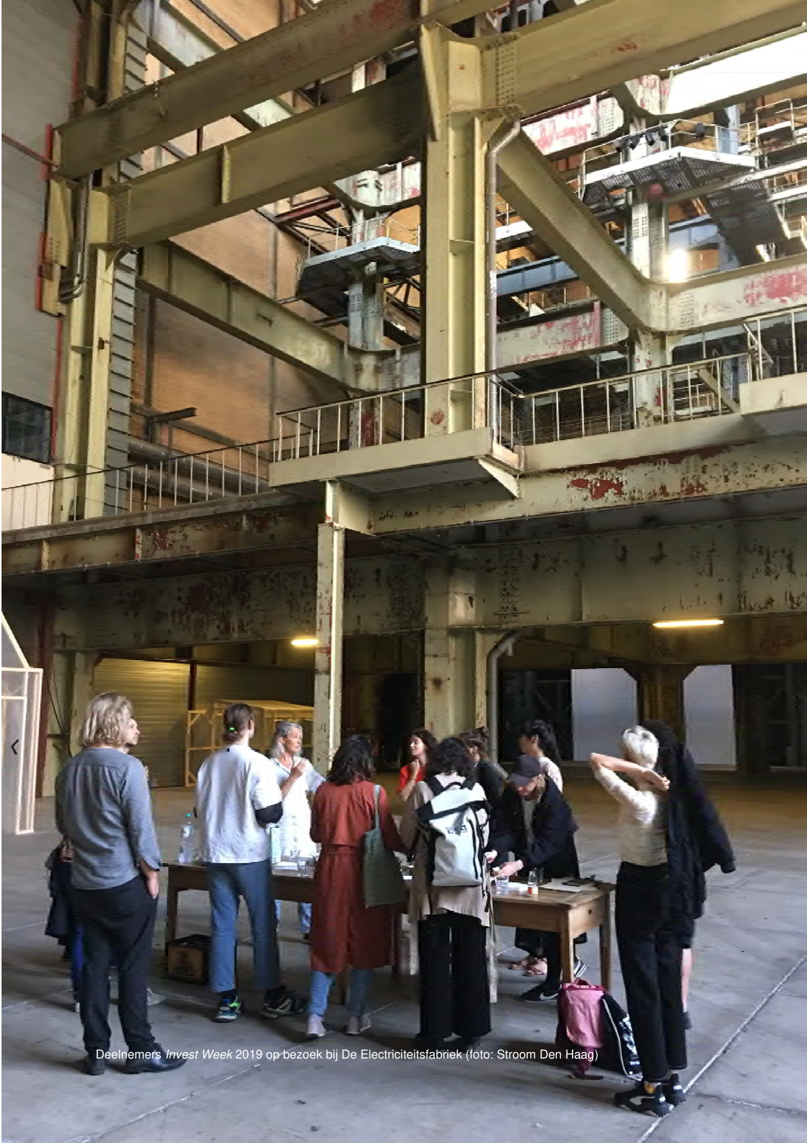
Deelnemers Invest Week 2019 op bezoek bij De Electriciteitsfabriek