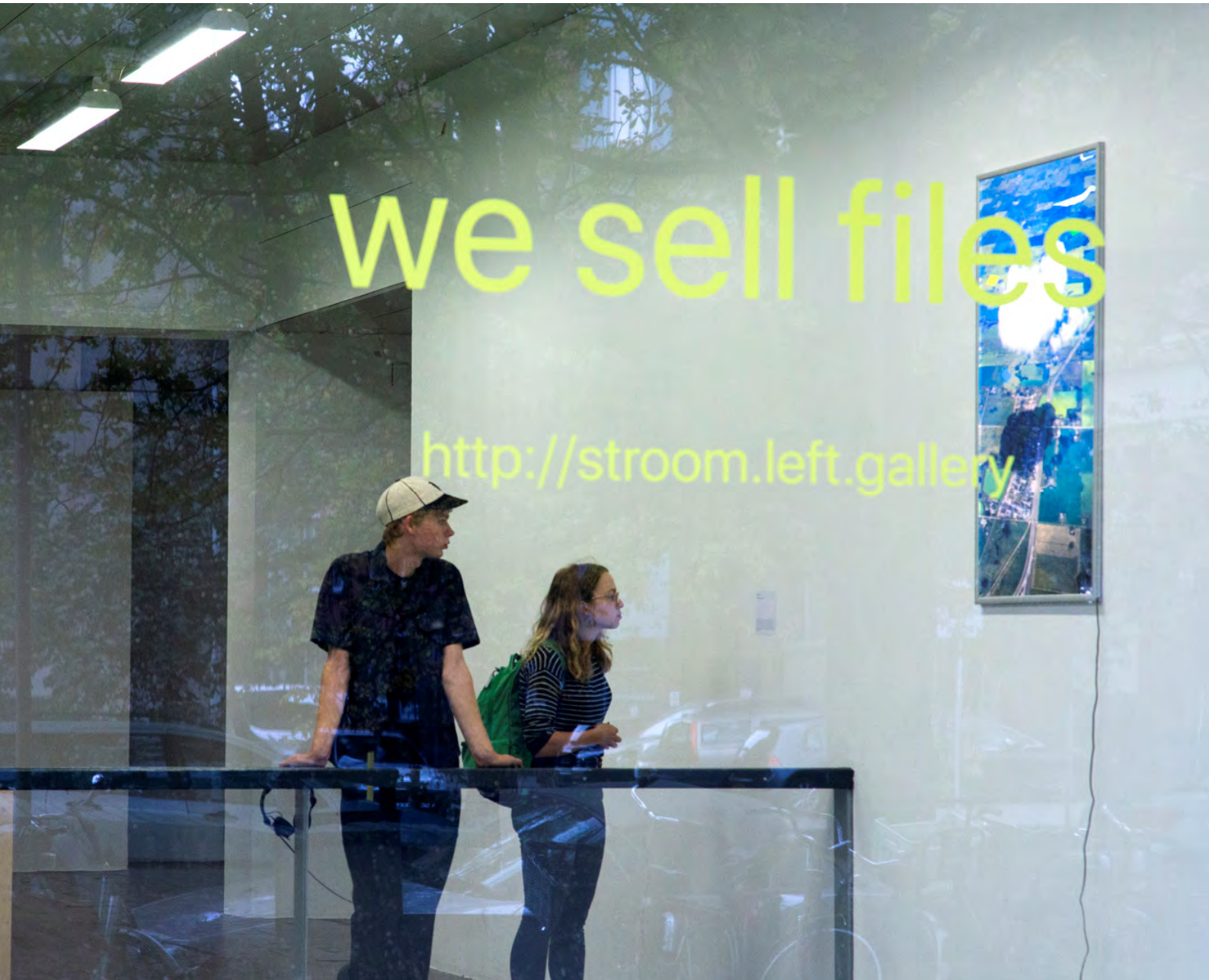
Our House, your Home: rite of access door left gallery