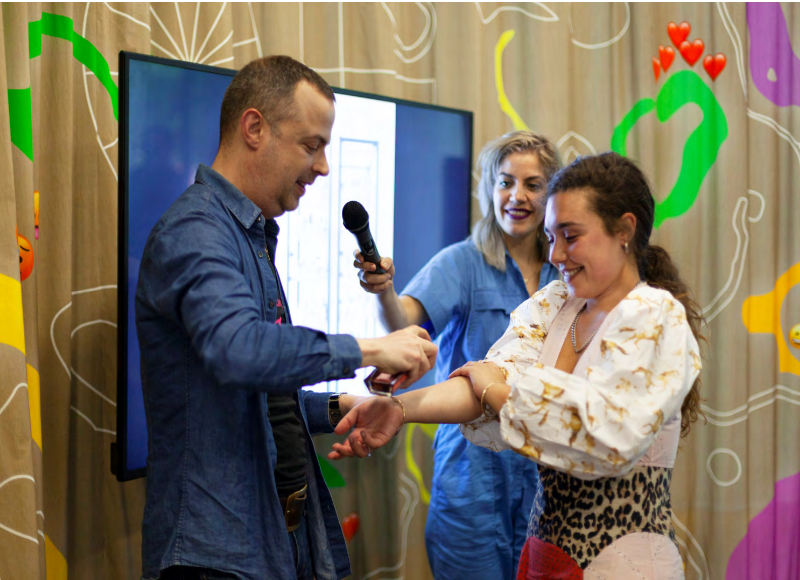
Uncertainty Seminars: Shadows of Tomorrow