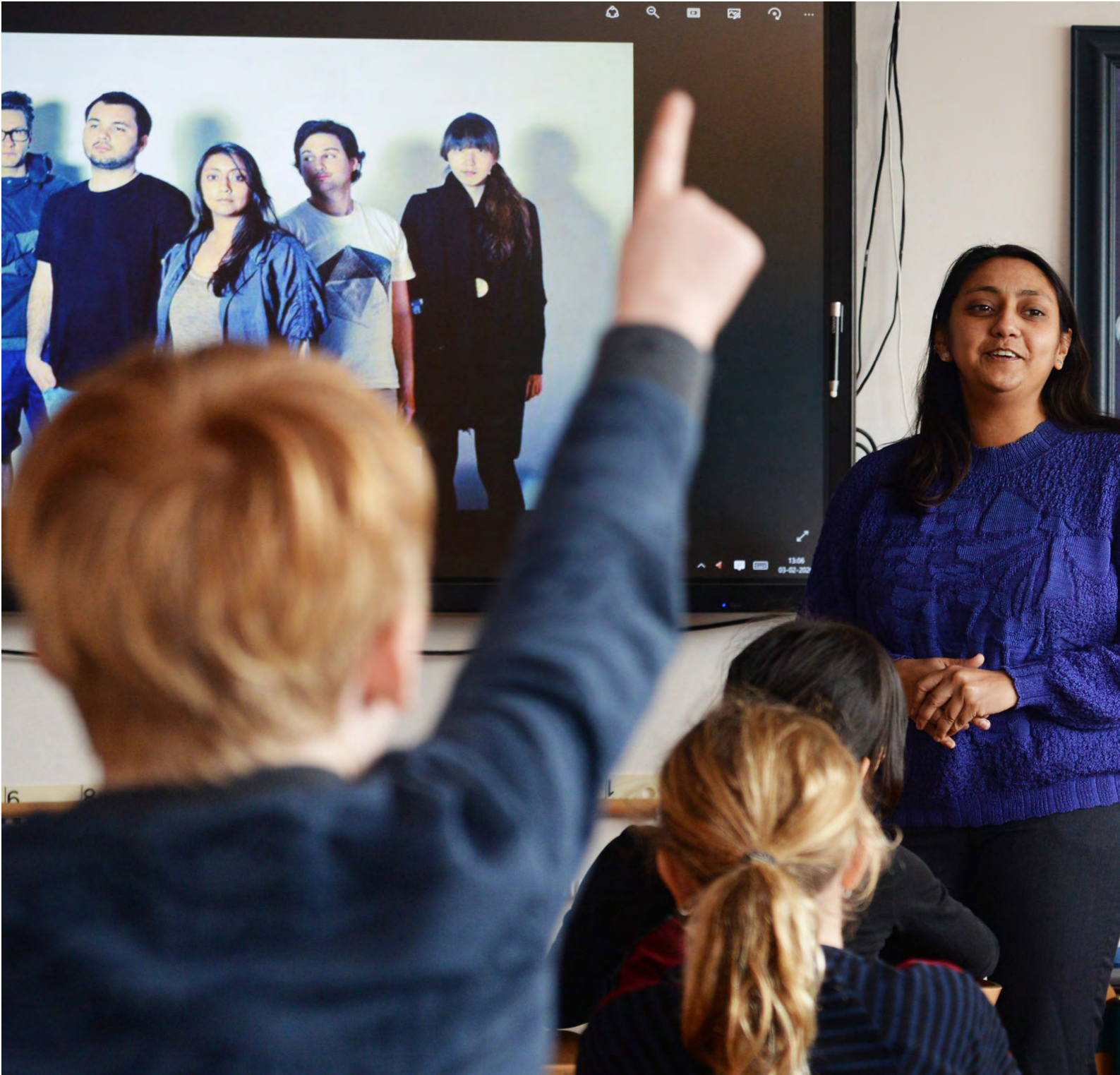
Educatie: KiK - Kunstenaar in de Klas